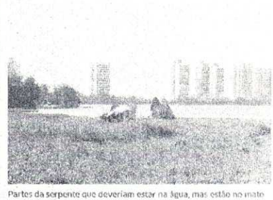
Partes da serpente que deveriam estar na água, mas estão no mar