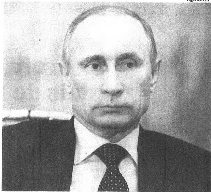
Presidente Vladimir Putin determinou ontem medidas contra a Turquia

... de obra ... na Rússia ... e se afetada