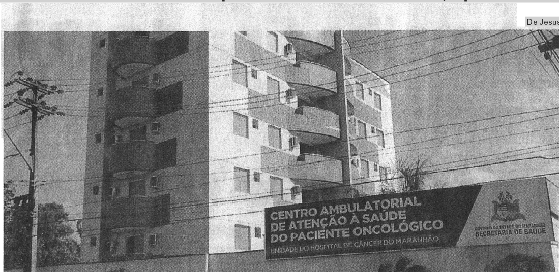
Prédio onde funciona o Centro Ambulatorial de Atenção à Saúde do Paciente Oncológico, no bairro Turu

ia direção da unidade de saúde, os serviços serão transferidos para o Hospital de 50 pacientes são atendidos pela unidade de saúde, que está em funcionamento há