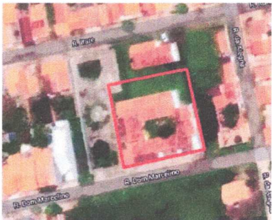
MAPA DE SITUAÇÃO/LOCALIZAÇÃO EM ESCALA