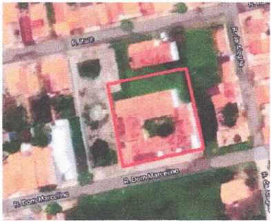
MAPA DE SITUAÇÃO/LOCALIZAÇÃO ESCOLA