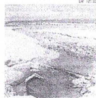
Área cedeu e expôs esgoto

Os banhistas parecem não se importar com a qualidade da água, no litoral maranhense. Várias pessoas foram flagradas por O Estado em momento de recreação no mar, na orla da Região Metropolitana de São Luis. O risco de contaminação e, alto, pois todas as praias monitoradas pela Secretaria de Estado do Meio Ambiente e Recursos Naturais (Sema), foram consideradas impróprias, após verificação feita pelo Laboratório de Análises Ambientais (LA), no mais recente relatório de balneabilidade.