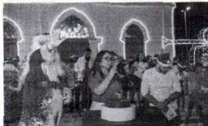
Prefeita Dinair Veloso: "Este é um mês muito especial, em que celebramos 133 anos da cidade de Timon"

Ainda no mês de dezembro, acontecerá a entrega da reforma do Centro de Reabilitação Maria do Carmo Neiva, inauguração de espaços públicos, como a Praça Sucupira e a Praça das Mangueiras, e a cerimônia de formatura do Proerd. Ainda como parte dos eventos programados, acontecerá a inauguração da Escola do Residencial Cocais e do Centro Médico de Exames de Imagem (Cemei), entrega do complexo esportivo Miguel Lima, café da manhã no Canal da Boa Esperança e inauguração da Casa do Cidadão. Essas e