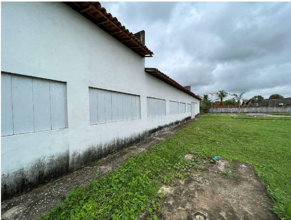
ÁREA PARA AMPLIAÇÃO