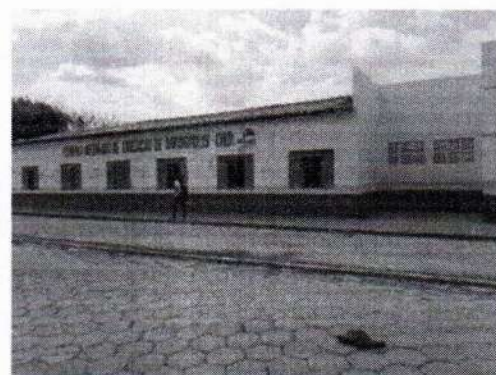
PRÉDIO DA CIED - IMPLANTAÇÃO DO PROJETO