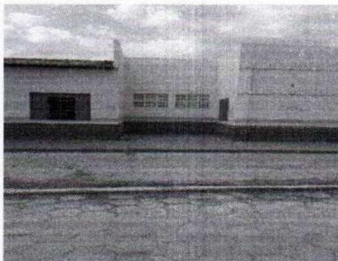
LOCAL DA SUBESTAÇÃO